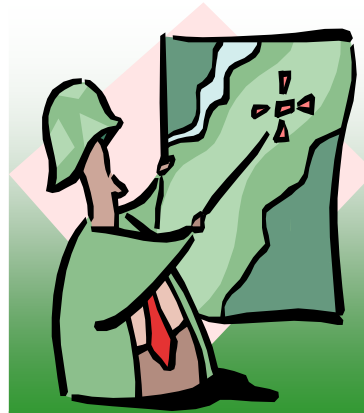
Estrategia de cada personaje

A pesar de su interminable lista de fracasos, continúa ciegamente fiel a los productos de ACME. Además, da por hecho que la “seguridad” de poseer el artilugio más moderno de ACME le garantiza la captura del Correcaminos”