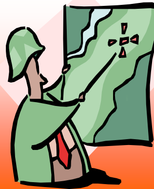
Estrategia de cada personaje

Es un férreo defensor de lo convencional por encima de lo experimental, y de la hipercautela por encima del riesgo. Sus planos, diagramas y planes están basados en la lógica, el orden y el comportamiento lineal